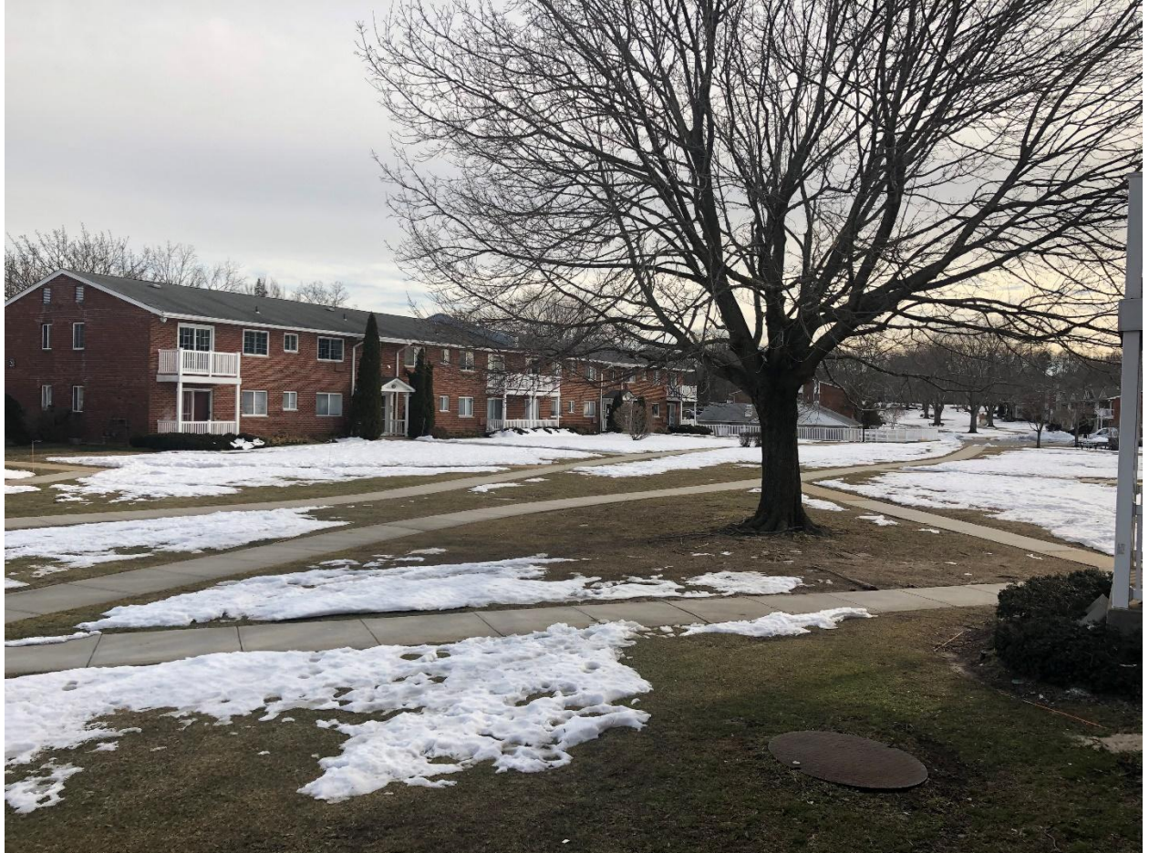
我在家门口照得。和上次对比一下